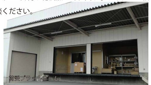
荷受プラットフォーム

物流センターの所在地は栃木県栃木市(本社と一緒に)です。敷地面積は1,000坪でクリーンエリア、準クリーンエリア、一般エリアとエリア分けをしています。また、2020年にISO9001(2015準拠品質マネジメントシステム)を取得し、安心安全なご対応可能な施設で364日(1月1日以外)稼働しています。「できること」は、ギフトセットアップ、包装加工、のし掛け、シール貼り、卦入などお客様のご要望にできるだけ対応できるよう努力しておりますので、何か物流加工でお困り事があればご相談ください。